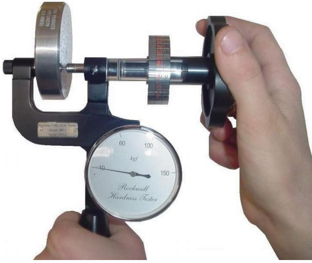
... Şekil 5...

Sonra tamburu 10 noktasına kadar geriye çevirin. Bu anda, ölçüm tamburu üzerinden HRC değerini okuyun. Şekil 6