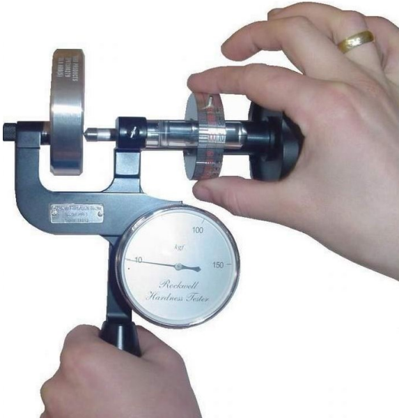
... Şekil 4...

Teste başlamadan önce uygun test için sertlik ölçme ucunu seçiniz. ( HRC ve HRA testi için Rockwell elmas uç, HRB testi için 1/16" bilya uç .) ve uygun şekilde cihaza yerleştiriniz. Sol elinizle tutma kolunu tutunuz.(Şekil 1, 2) Bu anda, dış kadran, ibrenin kırmızı noktada duracak şekilde ayarlanmış olmalıdır. (Şekil.1,11) İbre (Şekil 1, 10) SET noktasına gelene kadar, Yüklem tamburunu (Şekil 1,5) 10 a gelene kadar sıkıştırın. ( bu anda ön 10 Kgf ön yük uygulanmıştır.) Şekil 3