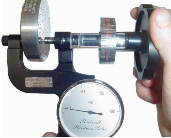
... Şekil 3...

Teste başlamadan önce uygun test için sertlik ölçme ucunu seçiniz. ( HRC ve HRA testi için Rockwell elmas uç, HRB testi için 1/16" bilya uç .) ve uygun şekilde cihaza yerleştiriniz. Sol elinizle tutma kolunu tutunuz.(Şekil 1, 2) Bu anda, dış kadran, ibrenin kırmızı noktada duracak şekilde ayarlanmış olmalıdır. (Şekil.1,11) İbre (Şekil 1, 10) SET noktasına gelene kadar, Yüklem tamburunu (Şekil 1,5) 10 a gelene kadar sıkıştırın. ( bu anda ön 10 Kgf ön yük uygulanmıştır.) Şekil 3