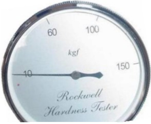
... Şekil 2...