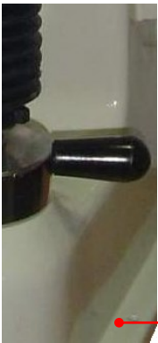
M8 bağlantı civatası

Cihazın ambalajını, çelik yan tespit saçlarının vidalarını çıkararak, yukarı doğru kaldırınız. Alt ambalaj plakasına cihazı tespit eden 2 adet M8 civatayı çıkararak, cihazın resme uygun olan özel masasına oturtunuz. Düz parça tablasının üzerine bir su terazisi koyarak, masanın alt ayar civataları yardımı ile cihazın düzgün olarak masaya tespitini sağlayın. Ana milin rahatlıkla inmesi için suntalam üzerine delik açmayı unutmayın. Daha sonra, sol kapağı açarak, emniyet takozunu çıkarın. Üst kapağın, 3 adet M6 imbus civatasını, aksesuar kutusundaki özel L alyen anahtar yardımıyla çıkarın. Üst kapağı hafifçe kendinize doğru çekerek, Rockwell saatine değmeden yukarı kaldırın ve plastik emniyetleri çıkarın.